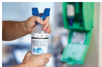
Øjenkoppen drejes, til forseglingen brydes