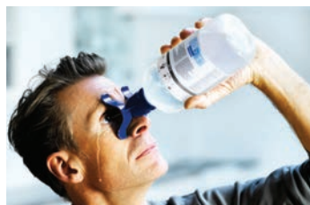
Læn hovedet bagover og skyl