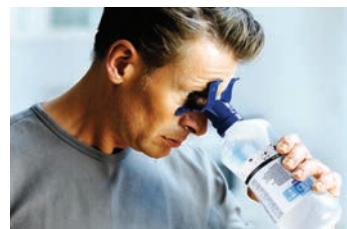
Læn dig eventuelt frem og skyl, hvis du vil undgå, at tøjet bliver vådt