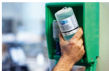
Flasken tages ud af øjenskylleboksen